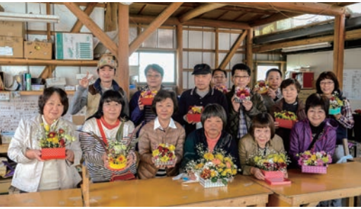
自分で作ったフラワーアレンジと一緒に集合写真

雇用もファンも続々と拡大していく小野花匠園の取り組みから、大切なことは何か考える