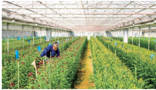
小野花匠園のハウス