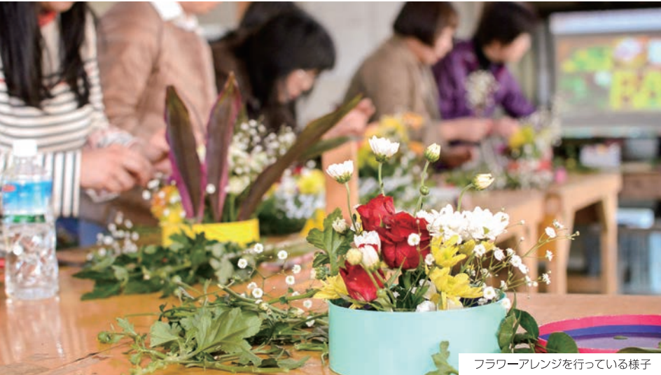
フラワーアレンジを行っている様子