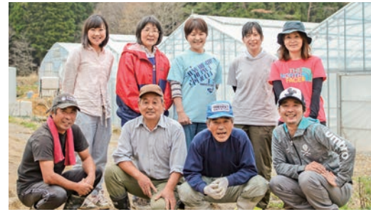
小野花匠園スタッフ