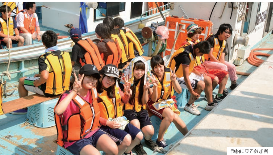
漁船に乗る参加者