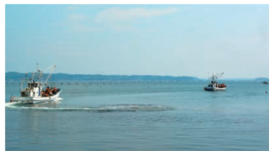
参加者を乗せていざ海上へ