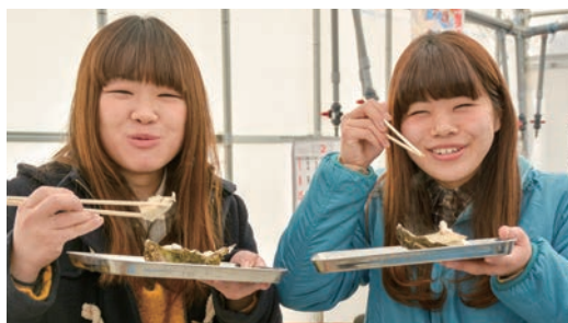
大きなカキをほおぼり笑顔がこぼれる