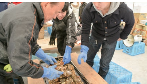
カキの焼き方を教わる参加者