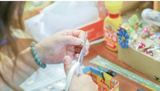
まゆ細工を制作している様子