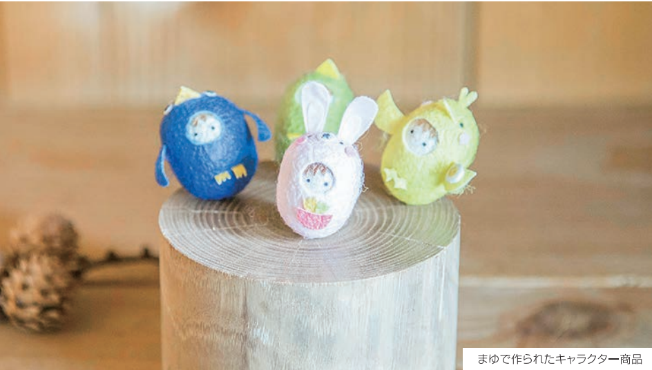
まゆで作られたキャラクター商品