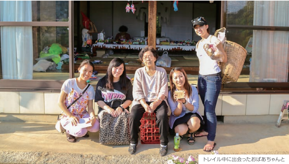
トレイル中に出会ったおばあちゃん