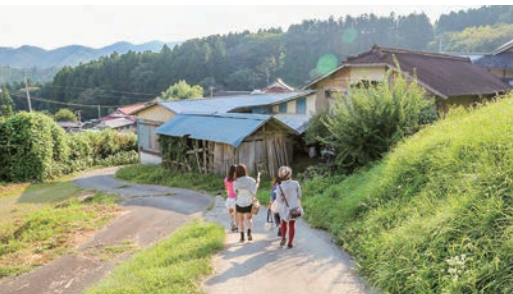
ポイントを探す参加者