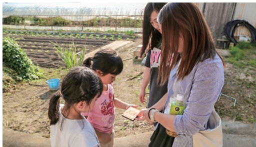
地域の子どもに場所の質問をする参加者