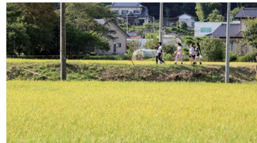
田んぼのあぜ道を歩く参加者